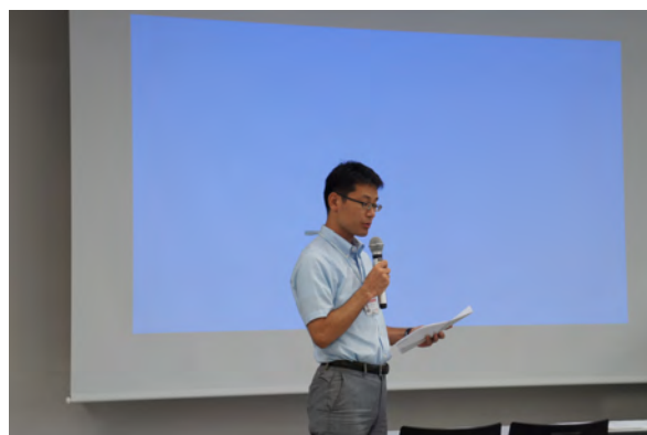
科目群会議の報告